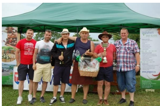
vít'azné družstvo Svatovci

Dňa 4. júna 2016 sme organizovali už VI. ročník obľúbenej kulinárskej súťaže „Vlčkovský guláš“. Na štarte sa tento rok stretlo sedemnást' súťažných tímov a spoločne sme si mohli