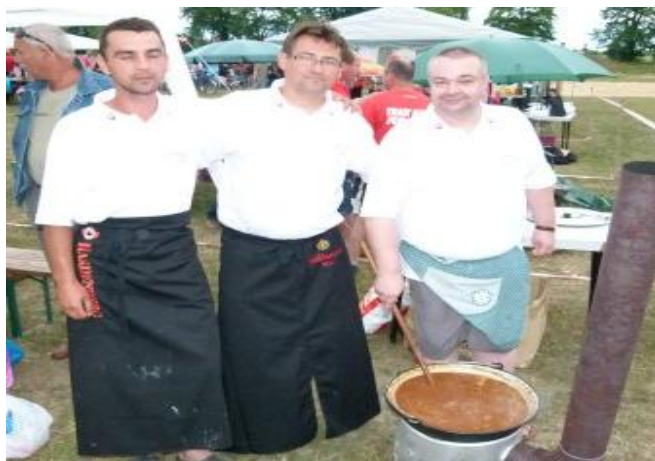
Víťazný Ludvik team