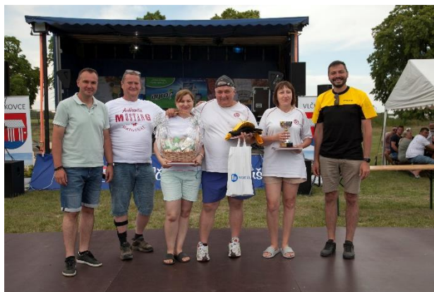
vítané družstvo "ZÁCHRANÁRI"

Dňa 4. júna 2022 obec Vlčkovce organizovala okrúhly desiaty ročník obľúbenej kulinárskej súťaže „Vlčkovský guláš“. Na štarte sa tento rok stretlo 15 súťažných tímov a spoločne sme si mohli vychutnať túto obľúbenú akciu. Teší nás, že aj po dvojiročnej pauze sa do súťaže zapojili staro-noví záujemcovia. Všetky súťažné tímy si odniesli symbolické víťazné poháre za svoju účasť a prvé tri mužstvá boli ocenené okrem víťazných pohárov aj vecnými cenami od spoločnosti PROGAST, s.r.o. a obce Vlčkovce. Samotná súťaž bola zahájená aj ukončená výstrelom z dela.