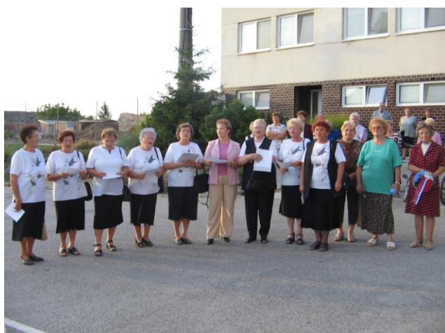
Kladenie venca k 63. – výročiu SNP