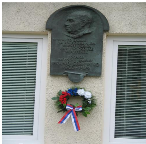
104. výročie narodenia Fraňa Štefunku