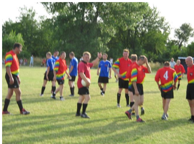
1. ročník futbalového turnaja JMB CUP