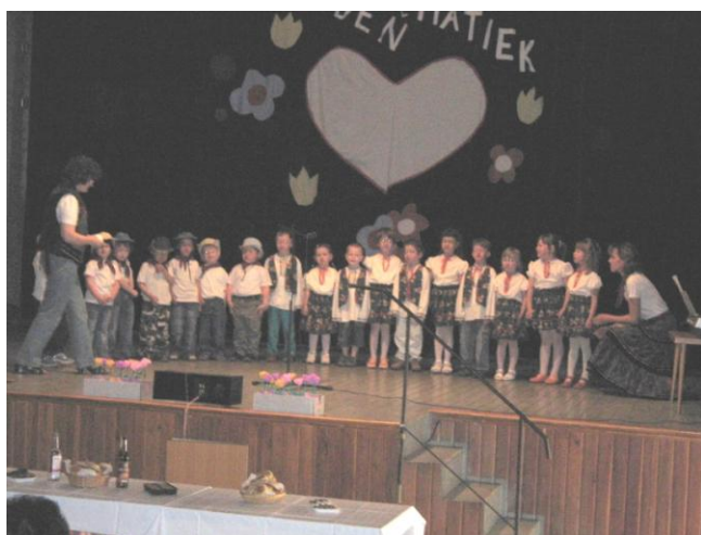
Deň matiek – vystúpenie škôlkárov