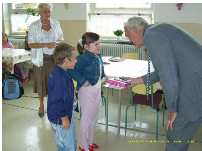
Zahájenie školského roku 2007/2008 – úvítanie prváčikov