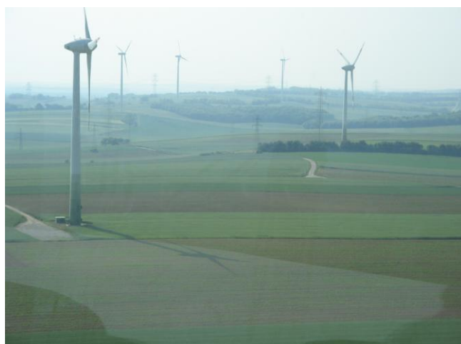
Návšteva veterného parku – Bruck an der Leitha